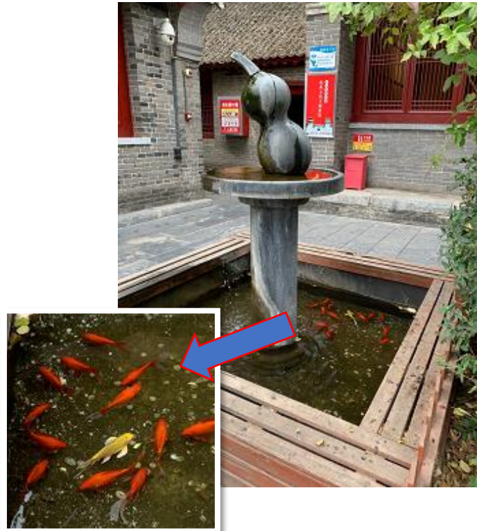
12匹の赤い金魚に1匹の黄金の金魚